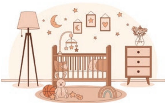
Alleen al het woord 'kindervens' roept sterke gevoelens op.

Dat doet geen recht aan eerdere wetten die aangenomen zijn door het parlement. Denk bijvoorbeeld aan de wet die regelde dat kinderen die zijn overleden in de moederschoot mogen worden ingeschreven in de burgerregistratie. Het kan niet anders dan dat