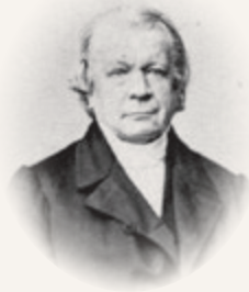
F.W. Krummacher (1796-1868)