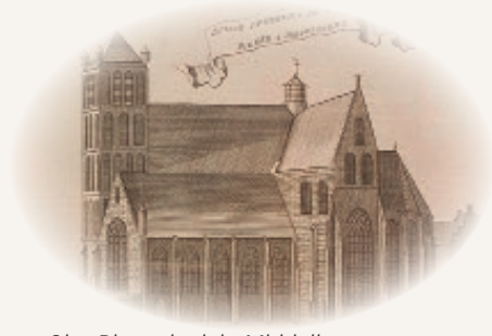
Sint-Pieterskerk in Middelburg

De pastor van Dundee preekte naar eigen zeggen als een stervende tussen stervenden. Zo dienen in het ambt verdient navolging van alle ambtsdragers!