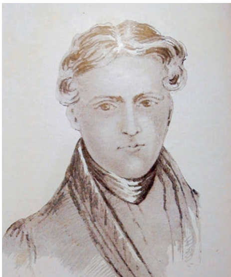
R.M. M'Cheyne, zelfportret 1843

De jonge Schotse dominee zag de regeerouderling als 'magistraat om over het huis van God te regeren'. Hoe? Door opzicht over de gemeente, ordebewaking in Gods kerk en handhaving van de tucht. Hij moet 'de wetten van Christus' huis toepassen', klinkt het vanaf de kansel.