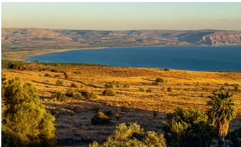
Het Meer van Galiléa.

aan Hem over te geven en om Hem te aanbidden zijn bewijzen van de macht van het ongeloof. Gods kinderen zijn wel verlost uit de staat van ongeloof, maar niet uit de macht ervan. We zien hier wat het gevolg ervan is: de Heere wordt niet aanbeden. Hij wordt beroofd van Zijn eer omdat Zijn kinderen niet kunnen geloven dat Hij het is. Bovendien leidt twijfel ertoe dat de ziel niet de ware vrede geniet. Twijfel verduistert het zicht op de kracht van Gods belofte.