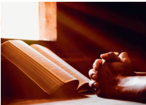
Een gebed vanuit echte bekommernis is eenvoudig en oprecht.

Is dit niet de gebedsgestalte waar Gods Woord op aandringt? De Heere Jezus zegt dat we geen ijdel verhaal of een veelheid van woorden moeten gebruiken. 'Want uw Vader weet wat gij van node hebt, eer gij Hem bidt' (Matth. 6:7,8), en dan volgt het volmaakte gebed. Daarbij moet het onze aandacht hebben dat dit niet begint bij onze noden. Maar het begint bij de verheerlijking van Gods majesteit. Pas daarna gaat het over dagelijks brood, vergeving voor ons zoals ook wij vergeven. Ook gaat het over niet in verzoeking te worden geleid, maar te worden verlost van de boze. Dit tweede deel van het volmaakte gebed gaat dus niet in op onze posities en verworvenheden. In plaats van dat we daaraan toekomen, wijst de Heere Jezus op de grond van het gebed. 'Want Uw is het Koninkrijk en de kracht en de heerlijkheid, in der eeuwigheid' (Matth. 6:9-13).