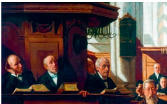
Ouderlingen in Amsterdam, 19e eeuw.

Dat kan niet zonder zelf in de leer te gaan. Hoe kan iemand geestelijk dienen die zelf geen leerjongen van Christus is? Eren en leren gaan hier hand in hand. 'Neemt Mijn juk op u, en leert van Mij, dat Ik zachtmoedig ben en nederig van hart' (Matth. 11:29). Ons onovertroffen 'formulier voor het bevestigen van