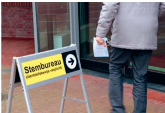
Voor een SGP'er moet het ondenkbaar zijn om een stem verloren te laten gaan.

Nog een paar dagen, en dan is het zover. Dan mag u die ene stem gaan uitbrengen. Op hoop van zegen. Het is en blijft een spannende avond, want juist die ene stem, die van u, telt mee! En daarna gaat er een andere stem spreken, namelijk van degene die als raadslid is gekozen. Als de nieuwe gemeenteraad wordt geïnstalleerd, klinkt