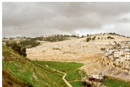
Het Kidrondal met de Olijfberg.

Het is nacht en het is volle maan. De meeste mensen slapen, maar Jezus niet.