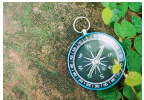
De vreze des Heeren stelt ons kompas af op Gods wet.