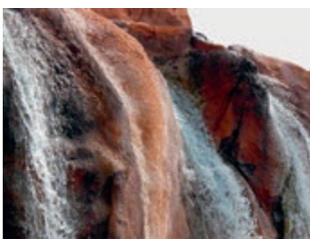
'En de steenrots was Christus.'

Justinus de Martelaar († 165), een vroege christelijke apologete, is over de uitleg van het Oude Testament serieus in gesprek gegaan met de Jood Trypho. (Dialoog met Trypho). Justinus zag in het Oude Testament veel direct Messiaanse beloften, maar ook herkende hij typen van Christus in personen en gebeurtenissen. Justinus gebruikte