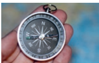
Een goed kompas staat afgesteld op Gods wet

Dr. P. Chr. van Olst, in opdracht van en overleg met Werkgroep Onderwijs. Reacties kunnen naar p.kieviet@hoeksteenscholen.nl