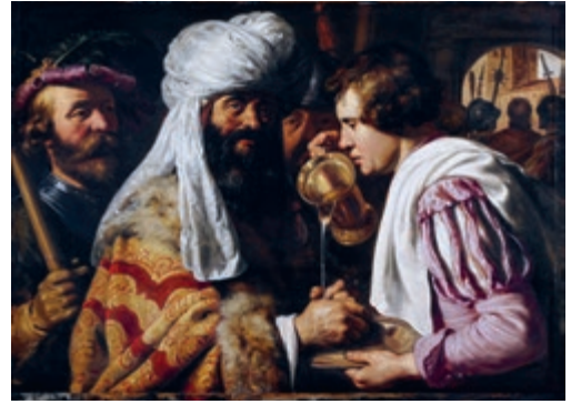
Pontius Pilatus (Rembrandt)