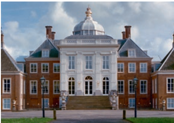
Over een paar dagen staat het eerste Kabinet-Jetten op het bordes van het paleis van de koning.

En juist dáár zit de zorg over het aantredende kabinet. Ongetwijfeld