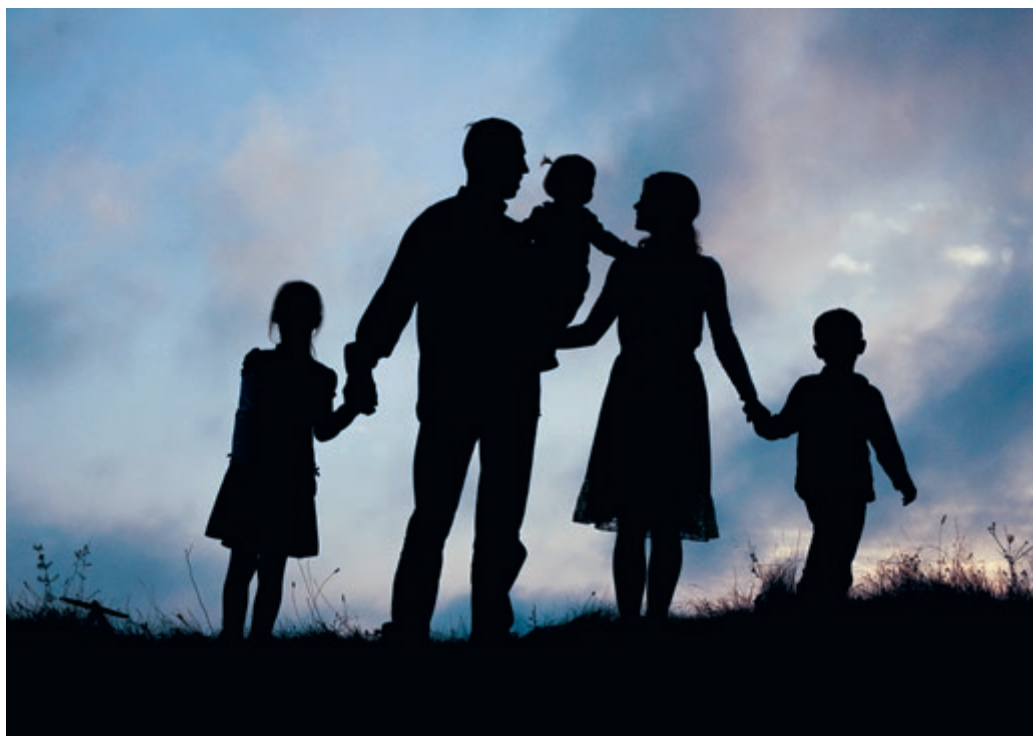
De moeder heeft in het gezin een bijzondere plaats.

daar in de dienst van de Heere opgevoed te worden. Ieder jaar bracht ze hem nieuwe kleding. Voor Hanna was het belangrijkste dat haar kinderen de Heere mochten dienen en vrezen.