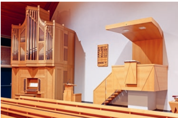
Wil de Heere in het leven van Zijn kinderen ook spreken door middel van een berijmde psalm?