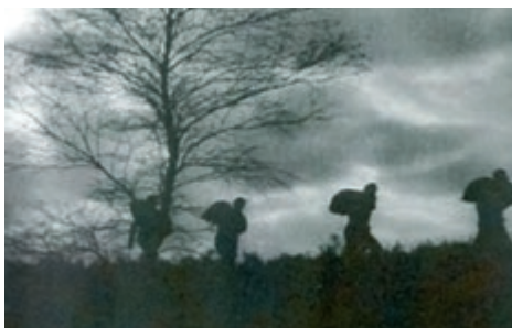
Volgens sommigen behoorde smokkelen tot de goede werken.

De volgende dag vertelde hij aan zijn vader wat hij gehoord had. Zijn vader lachte erom. Maar de volgende zondag, toen hij op de preekstoel stond, lachte hij er niet om. Hij heeft toen met kracht en ernst gepreekt over 1 Petrus 5 vers 8: 'Zijt nuchter en waakt'.