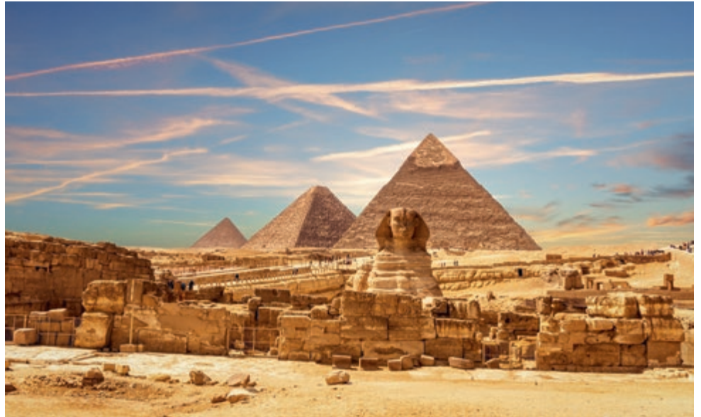
Jozef vlucht weg naar het onbekende land, niet wetende waar hij komen zou. Hij vertrekt samen met 'het Kindeken en Zijn moeder.'

Ambrosius vraagt zich af of Hij als de Zoon van God Zich niet van de dreiging van Herodes had kunnen bevrijden. Daar had Hij wel 'duizenderlei middelen' voor, zegt hij dan. 'Wat zou een vleselijke arm toch hebben kunnen doen tegen de God der geesten? Ware Jezus gedreven geworden door de geest van enige van Zijn discipelen, Hij zou het vuur van de hemel heb-