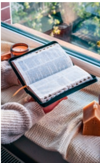
In sommige gezinnen komt er van structureel gezamenlijk Bijbellezen weinig meer terecht.

Verder kan de Bijbel met uitleg helpen. Die geeft niet alleen een